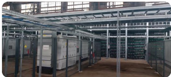
装机容量为 15 兆瓦的矿场