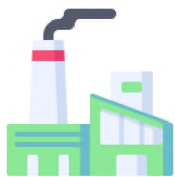
白俄罗斯共和国的发电装机容量