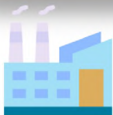
国家电力生产联合企业“Belenergo”的发电装机容量