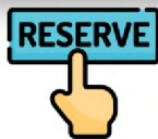
新用户发电装机容量储备