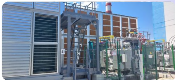
在建的一个装机容量为 65 兆瓦的矿场